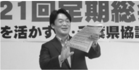
緊迫情勢を語る小西洋之参議員議員

千葉市中央区新田町7-5 石出ビル3F TEL 043-244-6865 FAX 043-244-6864 E-mail:sinsya@lily.ocn.ne.jp HP URL:http://shinsya-chiba.sub.jp/