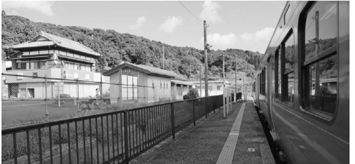
JR 久留里線 上総亀山駅 駅前の住宅と駅舎、出発を待つジーゼル車輛