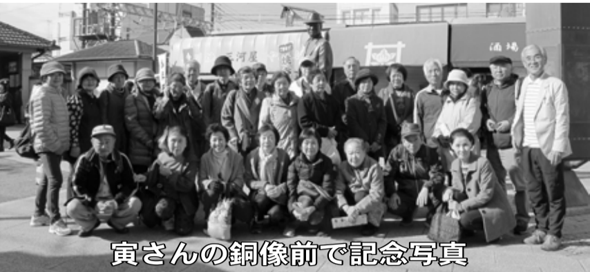
寅さんの銅像前で記念写真

高齡の方が多 いので「健康 で長生きでき ますように。」 「孫が元気で すくすく育ち ますように。」 とお願ひした のではないか と思います。 帝釈天から歩 いて10分ぐら いのところに ある山本亭を 見学。邸宅は かなり広く庭 には池があり