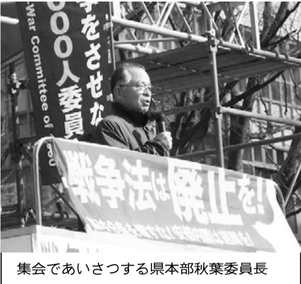
集会であいさつする県本部秋葉委員長