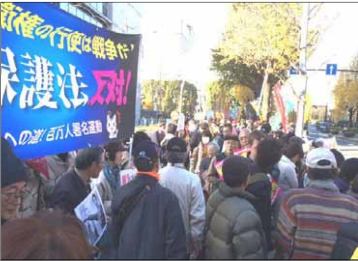
議員会館前は、抗議の人々で埋め尽くされた。

千葉市中央区新千葉2-1-1 新千葉ビル401 TEL 043-244-6865 FAX 043-244-6864 E-mail:sinsya@lily.ocn.ne.jp HP URL:http://www1.ocn.ne.jp/~nsp/