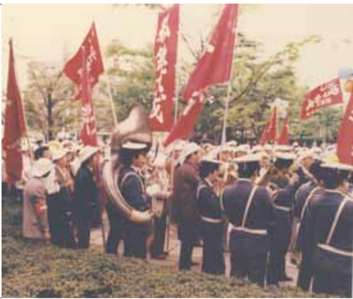
78年千葉市中央メーデー 42年間先頭指揮官を務めた京成ブラスバンド

1890年(明治23年)第2インターナショナルを結成した際に、世界の労働者が一斉にデ