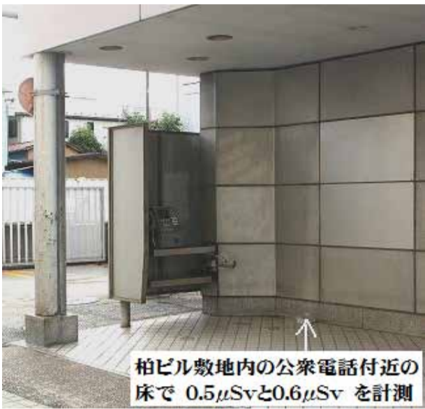
柏ビル敷地内の公衆電話付近の床で 0.5μSvと0.6μSv を計測

千葉市中央区新千葉2-1-1 新千葉ビル401 TEL 043-244-6865 FAX 043-244-6864 E-mail:sinsya@lily.ocn.ne.jp HP URL:http://www1.ocn.ne.jp/~nsp/