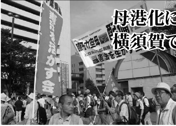
憲法を活かす会の会員もデモ行進に参加

7月19日に、横須賀で原子力空母の母港化に反対する集会がおこなわれ1万5千人が参加しました。集会後、原