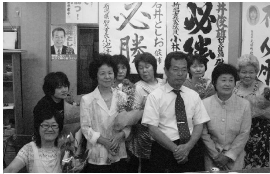
女性の力が当選の原動力となりました

情勢は厳しく、投票結果が出るまで、こんなに大差がついているとは誰も思っていませんでした。Q 勝因は何ですか。