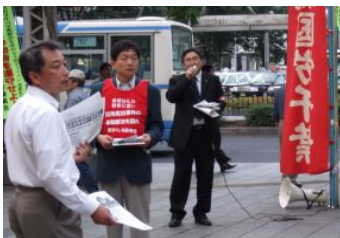
千葉駅頭での宣伝行動

闘争団員は北海道・九州から東京に向かつて上京しつつ、途中の自治体への要請や宣伝行動、連帯集会を行うキャラバン活動を4月から行ってきました。 千葉では、6月14日に北海道からのキャラバン隊を迎え、千葉駅での宣伝活動や県知事への申し入れ、支援労組への訪問、連帯集会等を行いました。