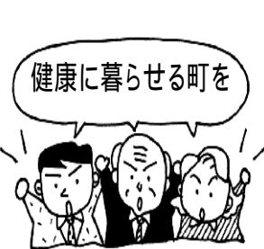
健康に暮らせる町を

割れ目から地中に漏洩したことや、70年代まで操業中に発生した廃棄物を敷地内に埋め立てていたことなどがあげられます。市は、「工場跡地周辺の土壌、大気、河川、地下水の環境調査を実施しましたが周辺環境への影響は認められず、汚染は敷地内に留まっていることが確認された」と報告しています。