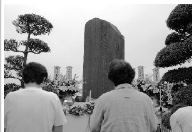
馬込霊園での追悼式

8月27日には千葉市内で「報告会」が行われ、「国家と軍が一体となつて行った国家犯罪である虐殺の真相の究明と謝罪がされていない。この国家責任を明確にするよう」堂本県事に申し入