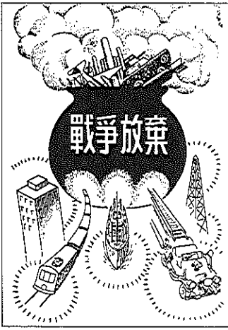
(文部省『あたらしい憲法のはなし』より)

この意見広告は「君津地域市民連絡会」が呼びかけ、地域の多くの人々の募金で掲載しています。