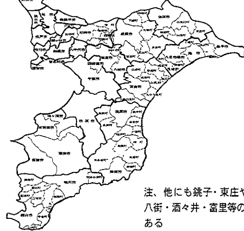
もっとも大規模に合併があった場合 県の推進要綱から作成