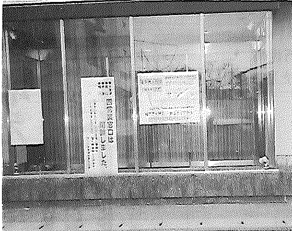
窓口がなくなり、労働者は遠くに転勤、街はさびれ不便になった。

「あなたの町の電話局こんなキヤッチフレーズを覚えていませんか。電電公社がNTTになった時のものです。ところが窓口は次々に廃止されて遠くなり、無人化で街の消費を支えていた電話局の労働者は姿を消しています。NTTは法律で公共性の維持が課せられていますが、さらに公共サービスを低下させる動きが出ています。 得体の知れない会社には行けない 電話部門の十一万人に及ぶ実質的な首切りです。 「NTTの設備(交換機など)の保守や営業を新しくつくる六十六の子会社(アウトソーシング)略称OSS会社に委託する。今の仕事を続けなければNTTを退職し、OSS会社に行きなさい(収入は三割程度下がる)。NTTに残ったらどんな仕事に変わるのか、どこに転勤させるかわからないよ」というもので、ここがこのOSS会社はまだ出来ていない、将来性もわからない、いつ倒産してもおかしくない会社です。 使い捨てはゴメンだ NTTのある労働者は「毒入りの飯頭とたんそ菌まがしの煎餅、どちらかを選べという代物だ。田舎の高校を卒業して電電公社に入社した時、会社のパンフレットには「独身寮完備」となっていたのに、いざ千葉にきたら住む所は自分で探せと言われ大変だった。交換手だった妻も頭肩腕障害という職業病にさせられたうえ、なれない仕事に移され、必死に仕事を覚えてきた。社員のようにした苦勞が今のNTTを作り上げた。NTTはドコモ(携帯電話)などのグループ会社を総合すると大赤字だ。今になって勝手に会社を分割して「赤字だ、出