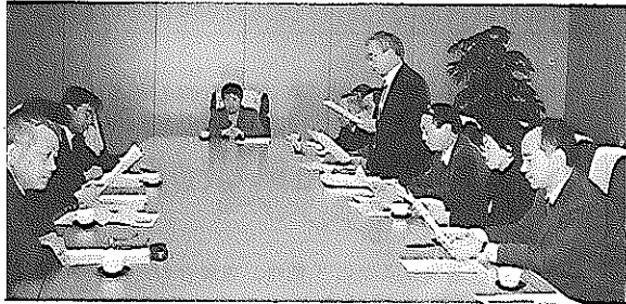
申し入れを行う協議会代表

二十一日に出航する際に厚木基地で激しい夜間離発着訓練を行ったこと、さらには六月に在日米海軍司令官が、現在硫黄島で行っている夜間離発着訓練について不満を表明し、「厚木基地から百八十km以内に代替施設を確保することが必要」と述べたことを踏まえ、下総基地が再び空母艦載機の夜間離発着訓練に使用される危険が高まっているこ