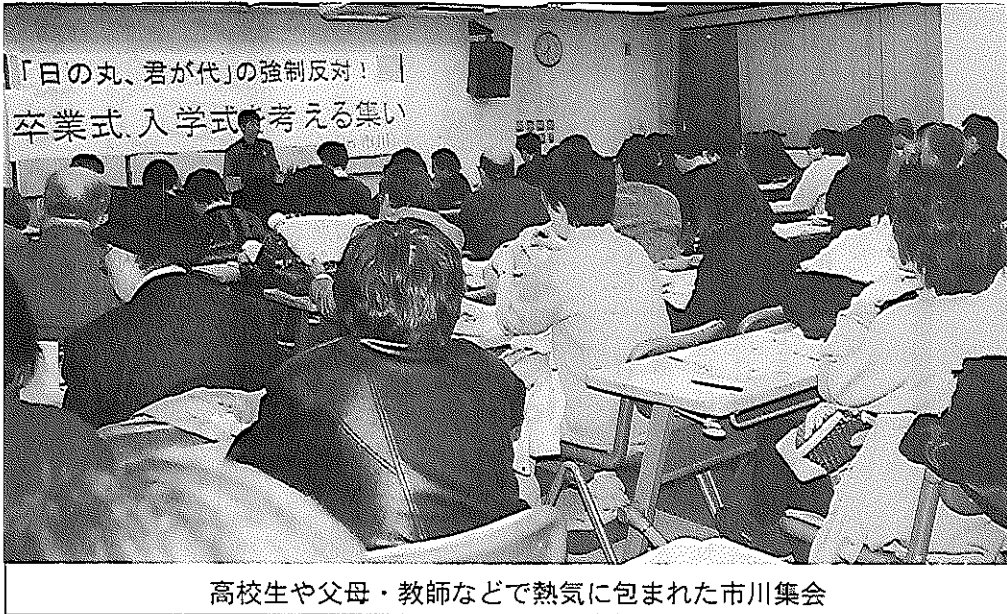
高校生や父母・教師などで熱気に包まれた市川集会

国旗・国歌法が制定されて二度目の卒業式、入学式を迎えた。国会では、「強制しない」と決まったのに、実際には、「学習指導要領」に基づく「職務命令」という形で、県教委が校長を通じ、強制している。