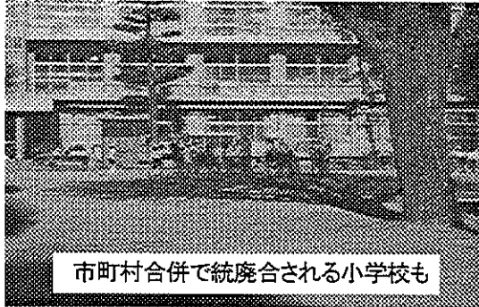
市町村合併で統廃合される小学校も

市町村合併で統廃合される小学校も。千葉県、船橋・東葛地区の都市部では児童五百人に平均一校の小学校があるが、外房町村では、児童が八十九人の小学校もある。市部と合併が行われれば、「平均化」のために、小さな小学校は廃止・統合され、子供は遠い道