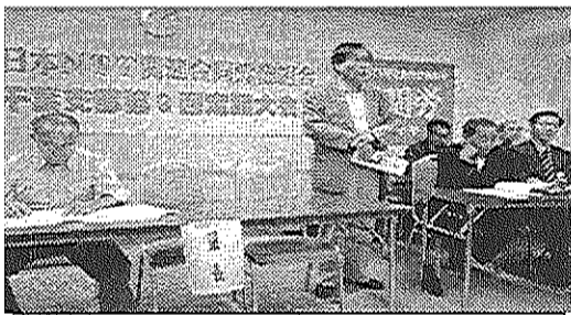
鳩川反失業共闘事務局長と来賓の皆さん

一宮町にお知り合いのある方は新社会党までご紹介ください。 【連絡先】 一宮町宮原1078の7 TEL0475(42)5617